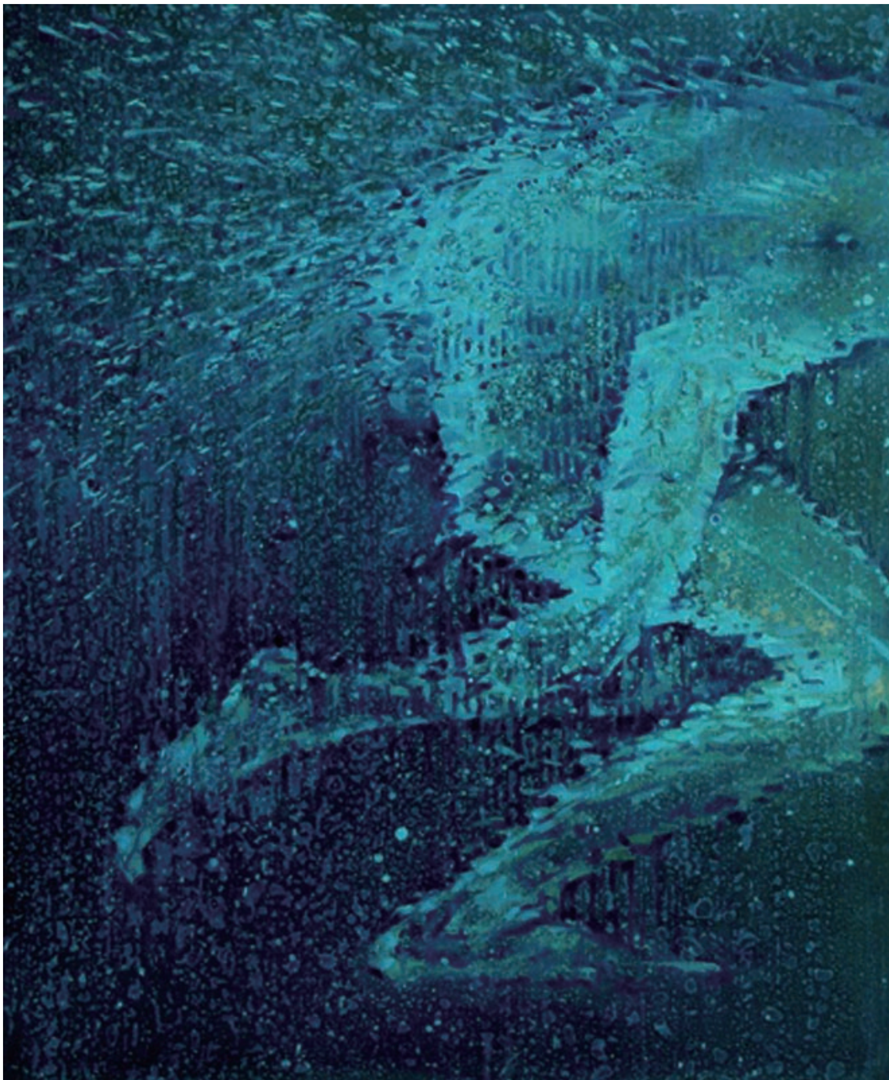
Pogo之旅 Die Reise des Pogo 2008 100x80cm 布面油彩 Oel auf Leinwand