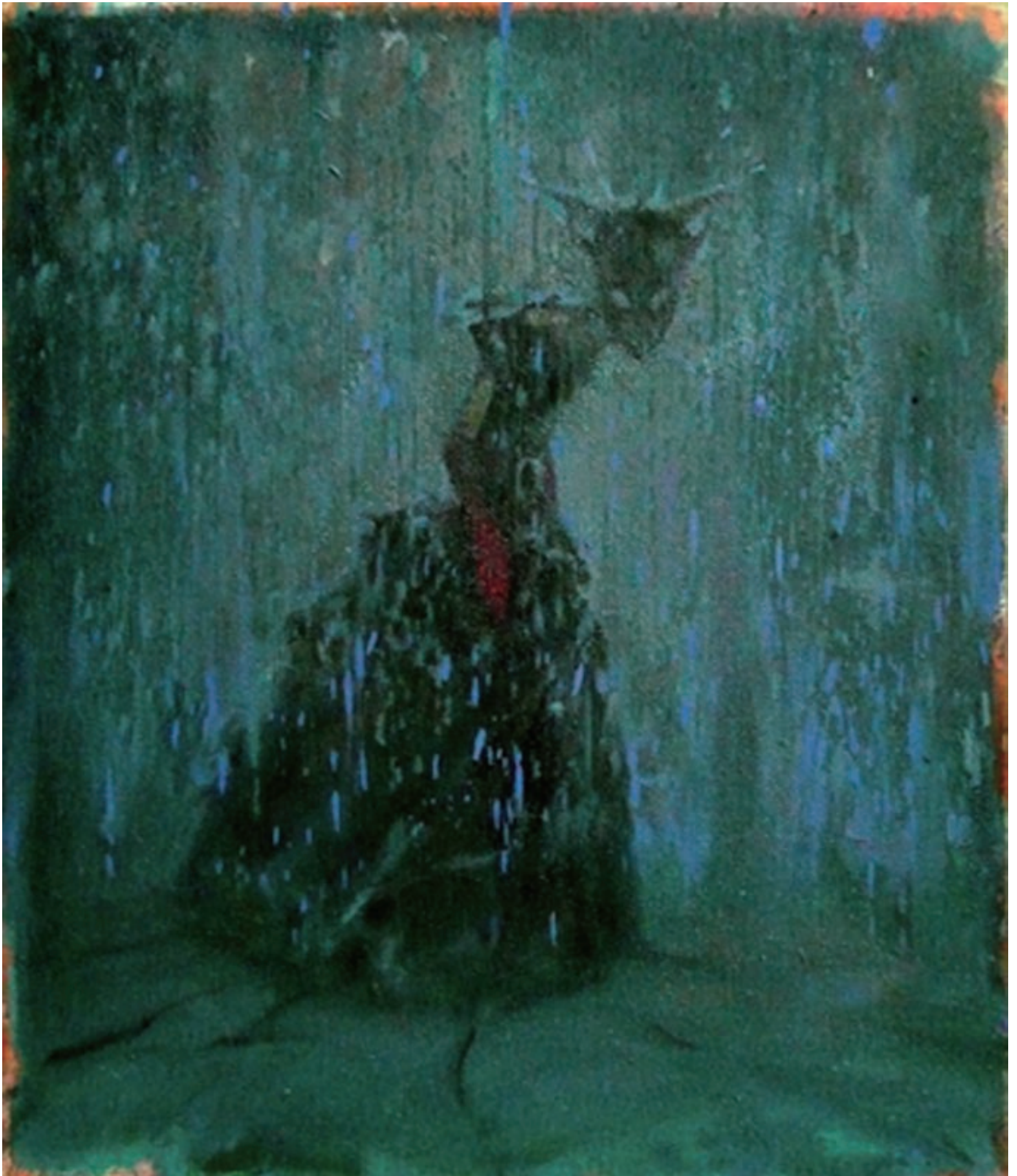
深色雨 Dark Regen 2008 210x170cm 布面油彩 Oel auf Leinwand