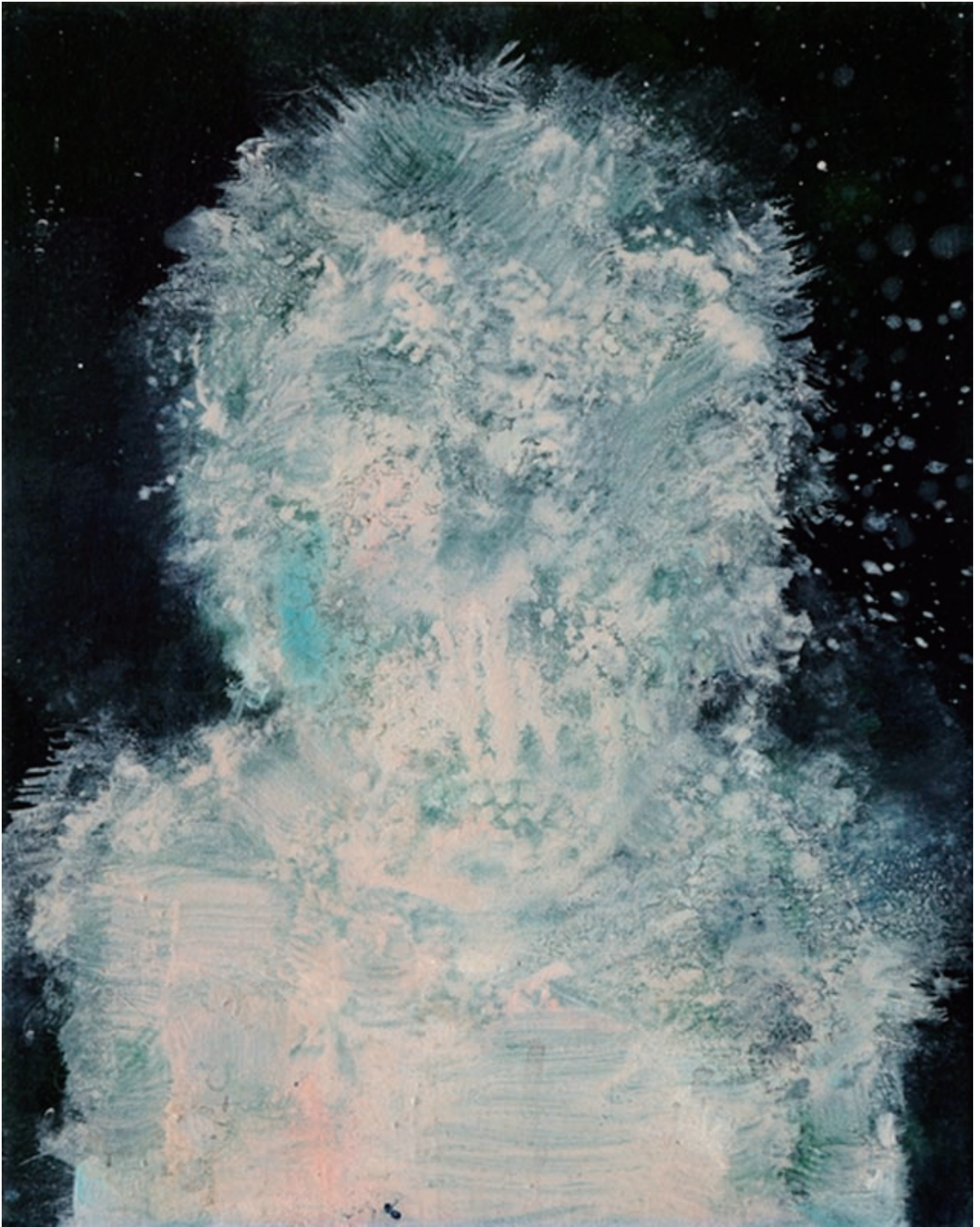
先锋青少年1 Junger Pionier1 2006 24x30cm 布面油彩 Oel auf Leinwand