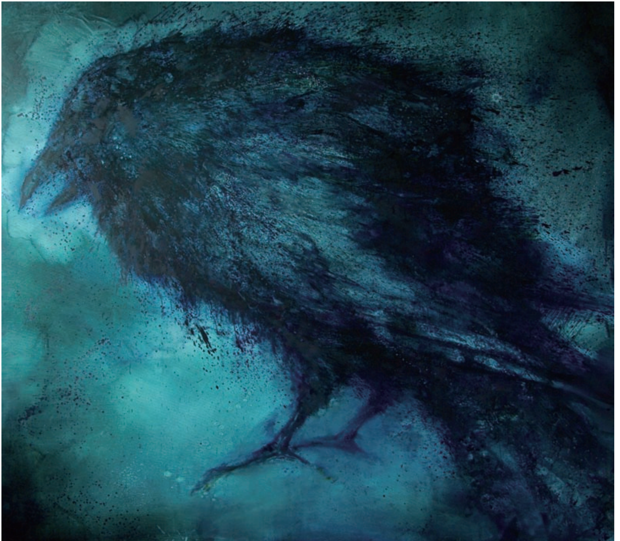
黑色动物 Schwarze Tiere 2006 210x230cm 布面油彩 Oel auf Leinwand